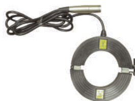
Клещи индукционные КИ-110